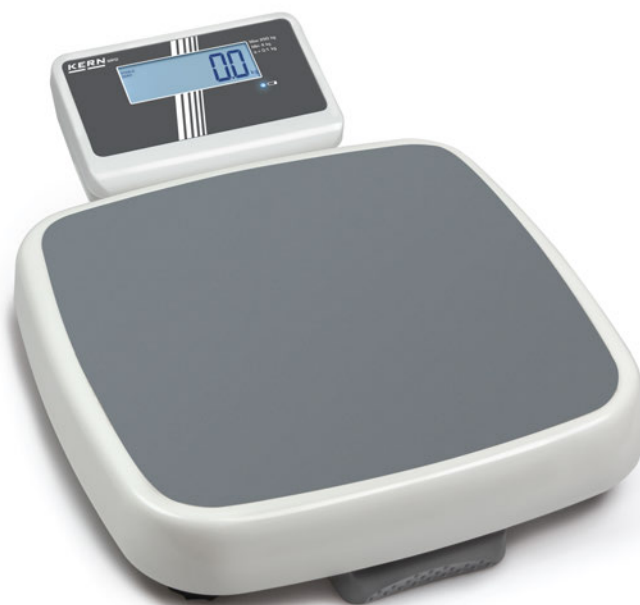
KERN MPD 250K100M

Pèse-personnes Step-On professionnel avec approbation d'homologation et médicale